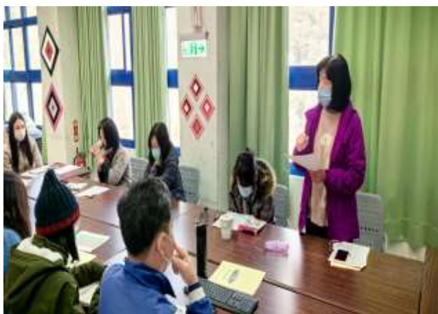
說明:晨會提出值週問題並檢討改進