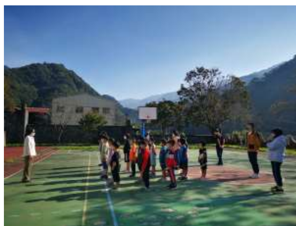
說明:升旗實施各項宣導