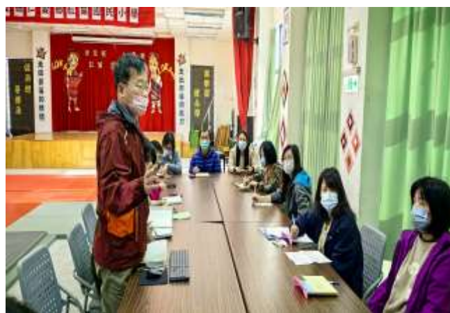
說明:晨會提出值週問題並檢討改進