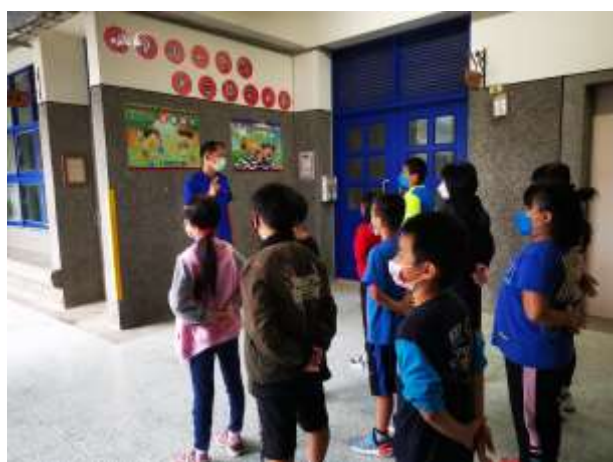
說明:升旗實施各項宣導