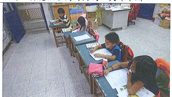
說明：孩子們將看完的影片作相關的討論與紀錄。