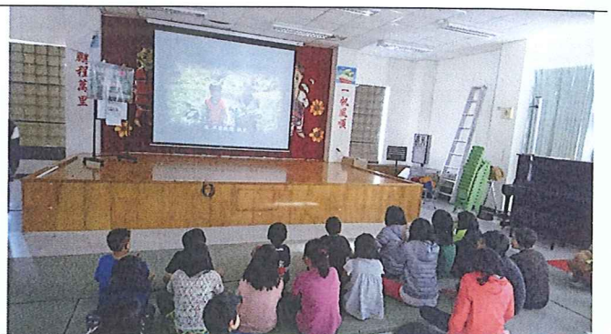
說明：影片中部落的生活和孩子們的生活很貼近，引起孩子們的共鳴，笑聲不斷。