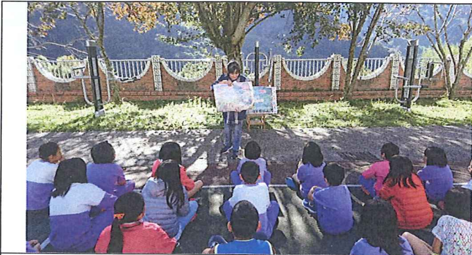
說明：生命教育月，孩子們仔細聆聽「只要我長大」影片導讀。