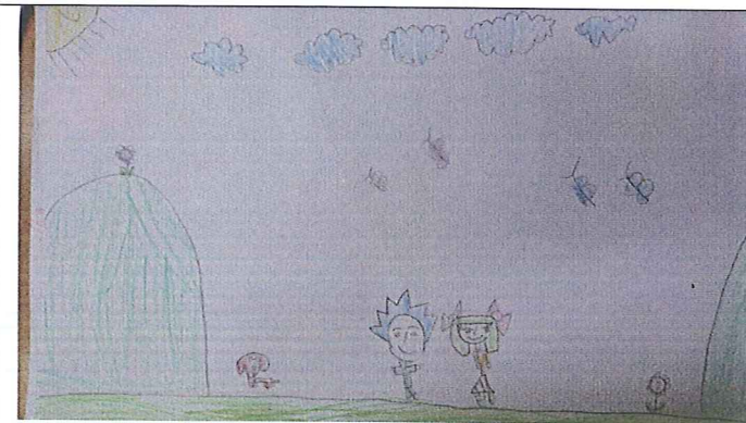
說明：學生作品，青山白雲是孩子們熟悉的环境，也是孩子們對影片深刻的印象描述。